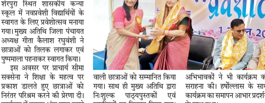
हरिभूमि न्यूज | विदिशा

पहले दिन प्रवेशोत्सव में छात्राओं को साइकिल व पाठ्यपुस्तकों का वितरण हरिभूमि न्यूज | विदिशा